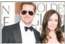
'골든 글로브' 스타들