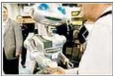
로봇과 악수한 소감은?