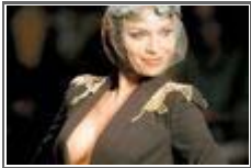
여배우 아찔한 유혹